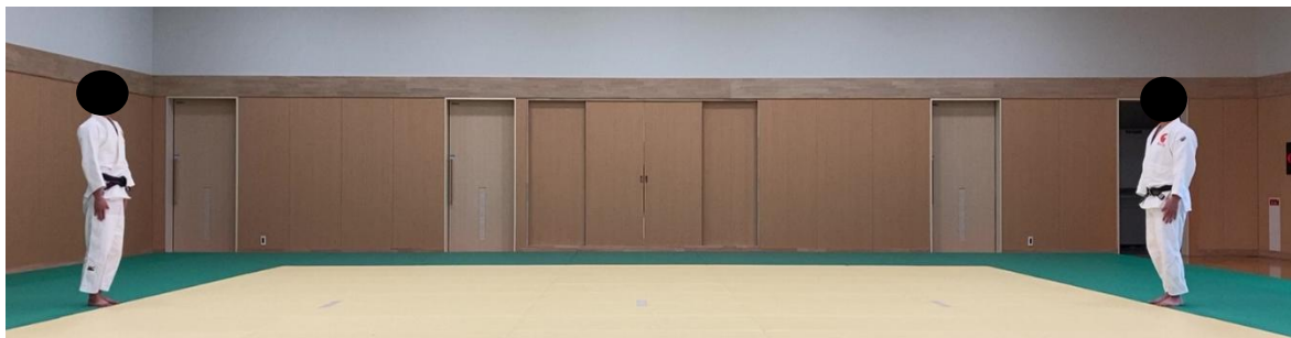
図1 望ましい撮影範囲