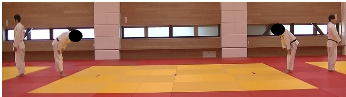
図2 受理できない撮影範囲（演技者以外が入り込んでいる、映像が遠い）